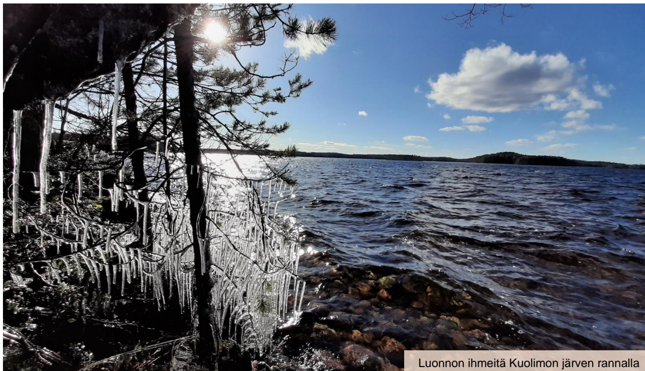
Luonnon ihmeitä Kuolimon järven rannalla